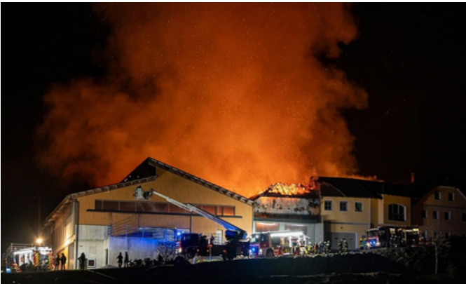
Brandeinsatz, St. Georgen, 6. März 2025

Am 6. März 2025 wurde ein Brand in einem landwirtschaftlichen Anwesen in St. Georgen am Walde gemeldet. Der Feuerschein war bereits aus großer Entfernung sichtbar, weshalb die Alarmstufe umgehend erhöht wurde. Beim Eintreffen der Einsatzkräfte stand der Stall bereits in Vollbrand.