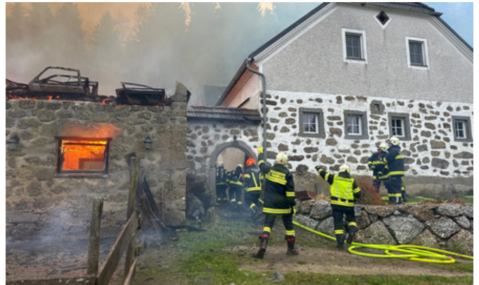
Brandeinsatz, St. Thomas, 27. Oktober 2025

Am 27. Oktober 2025, geriet in St. Thomas am Blasenstein der Wirtschaftstrakt eines Bauernhofs in Brand. Beim Eintreffen der ersten Feuerwehren stand das Gebäude bereits in Vollbrand.